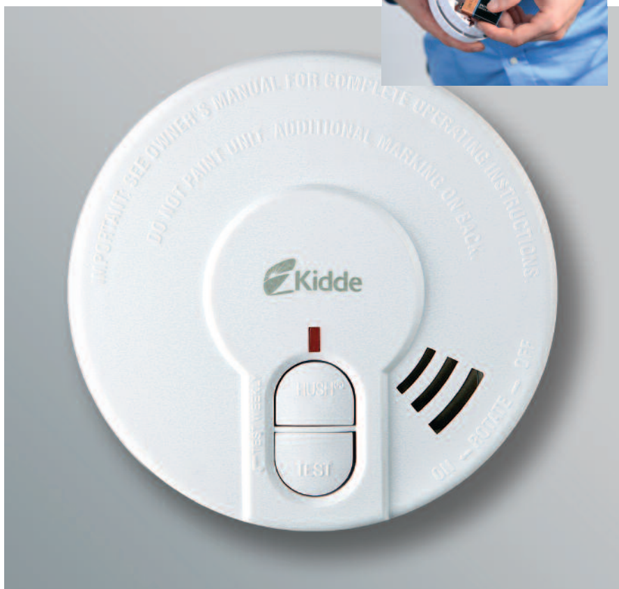
Abb. = 29 HD-L / 29 HD